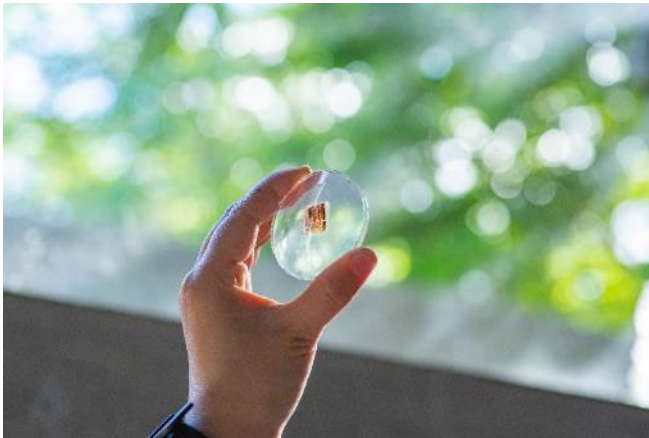
リサーチ風景 風の教会にて 2024 年 めがねレンズ、外国の切手

本芸術祭では、 会期中のみ公開される安藤忠雄設計の風の教会で、アーティスト宮永愛子が神戸でのリサーチにより生まれた新作を発表します。